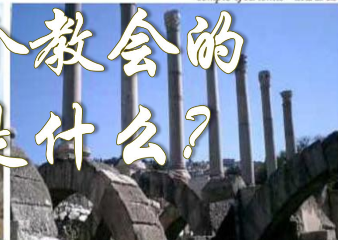
Temple of Artemis - SARDIS