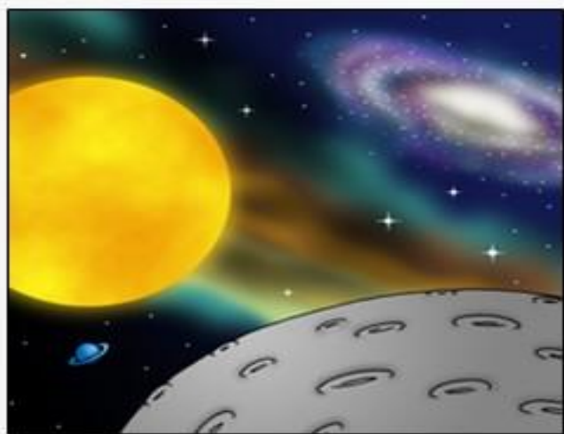
第 4 日