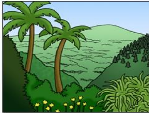
第 3 日