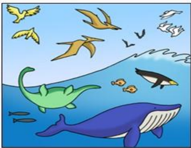
第 5 日