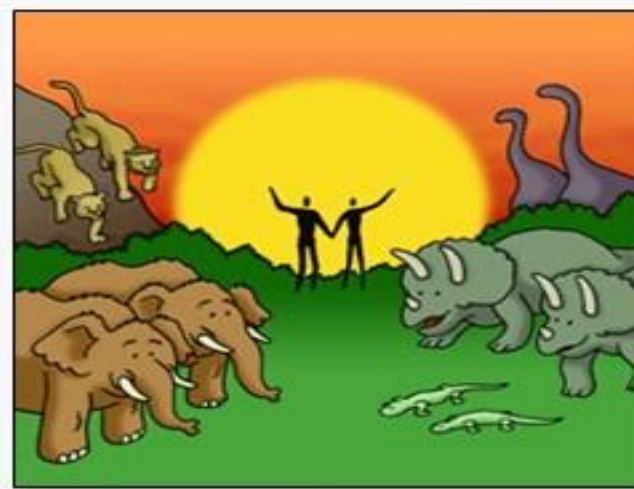
第 6 日