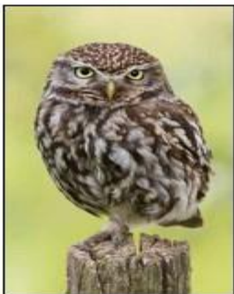
鴉鳥 little owl