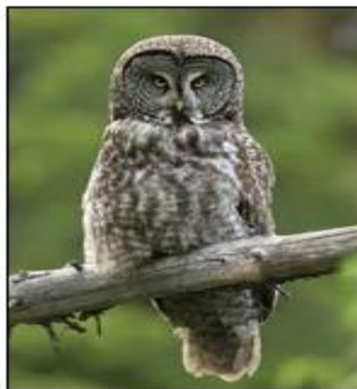
貓頭鷹 great owl