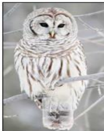
角鴟 white owl