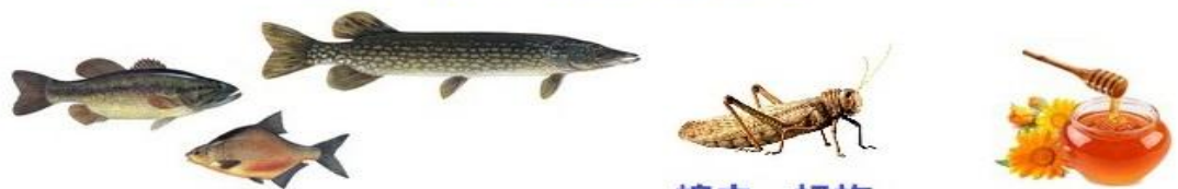
各种有翅有鳞的鱼