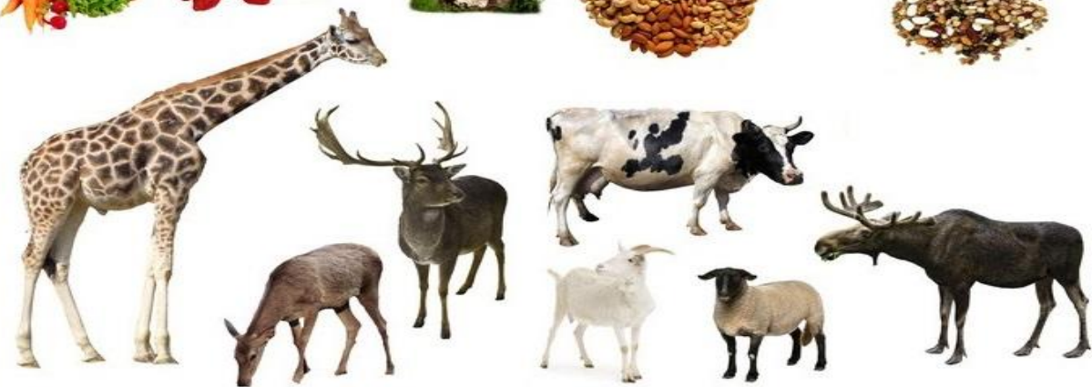
偶蹄目反刍亚目的动物，常见的有牛、羊、羚、麝、鹿、长颈鹿等。