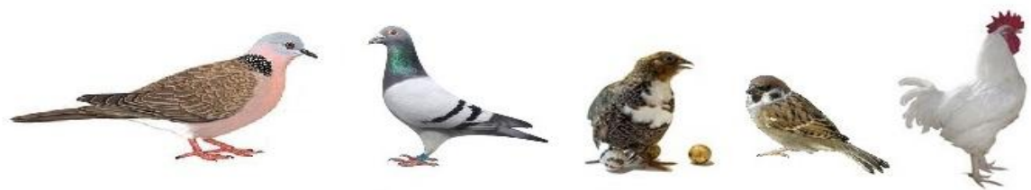
斑鸠、鸽子、鹌鹑、麻雀、鸡