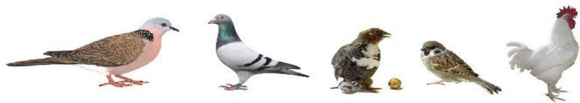
斑鸠、鸽子、鹌鹑、麻雀、鸡