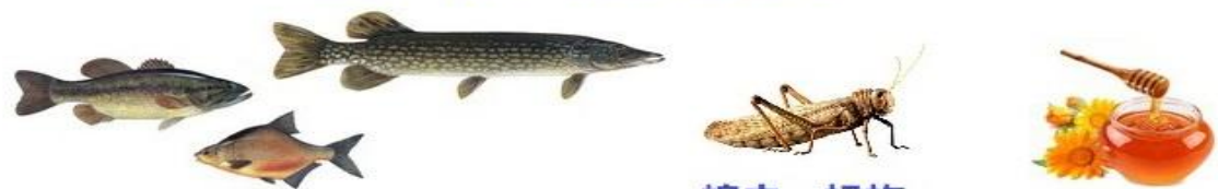
各种有翅有鳞的鱼